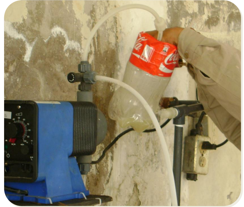
LIMPIEZA CON SOLUCIÓN DE ACIDO MURIATICO Y AGUA, PARA EVITAR ACUMULACIÓN DE RESIDUOS