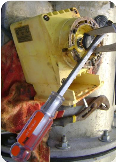
UTILIZACIÓN DE KIT DE REFACIONES