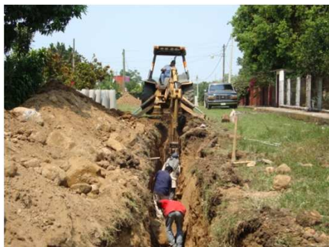
EXCAVACIÓN CON EQUIPO

FORTIN DE LAS FLORES, VER.- AMPLIACIÓN DE LA RED DE DRENAJE SANITARIO, EN LA LOCALIDAD DE VILLA UNIÓN.