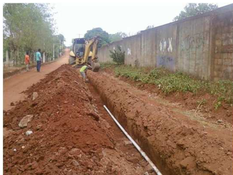
TENDIDO DE TUBERÍA DE 2 1/2" DE DIAMETRO

ACAYUCAN, VER.- CONSTRUCCIÓN DEL SISTEMA DE ABASTECIMIENTO DE AGUA POTABLE EN LA LOCALIDAD DE APAXTA.