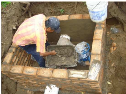
CAEV COMISIÓN DEL AGUA DEL ESTADO DE VERACRUZ