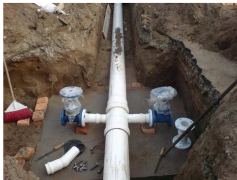
VALVULAS DE SECCIONAMIENTO DE 3"Ø EN RED INSTALADA