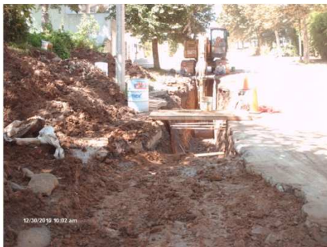
EXCAVACIÓN CON EQUIPO

XALAPA, VER.- CONSTRUCCION DEL COLECTOR PLUVIAL AV. PASEO CUAUHEMOC, EN LA LOCALIDAD DE XALAPA.