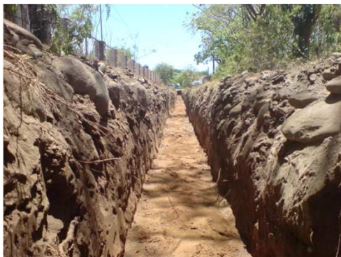
CONSTRUCCIÓN DE PLANTILLA

NAUTLA, VER.- REHABILITACIÓN DEL SISTEMA DE ABASTECIMIENTO DE AGUA POTABLE (SEGUNDA ETAPA), EN LA LOCALIDAD DE NAUTLA.