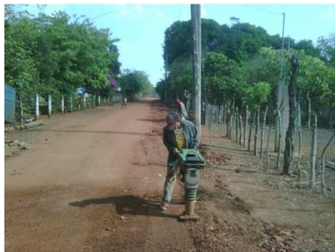
CAEV RELLENO COMPACTADO COMISIÓN DEL AGUA DEL ESTADO DE VERACRUZ