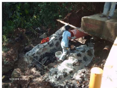
ESTRUCTURA DE DESCARGA