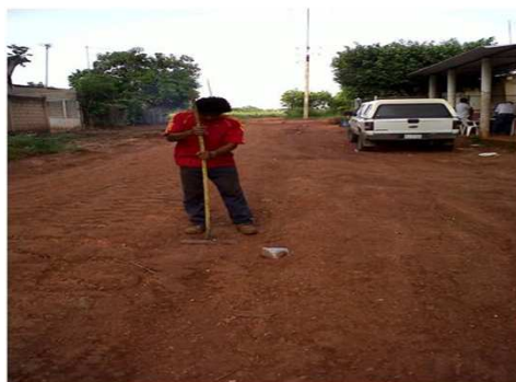
OBRA TERMINADA (CONTROL DE CALIDAD)

EMPRESA: DESARROLLO Y COMERCIALIZACIÓN DEL CENTRO, SA DE CV.