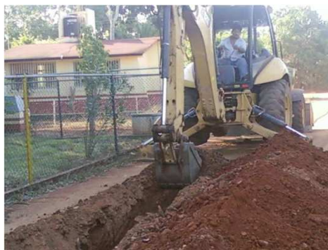
EXCAVACIÓN CON EQUIPO