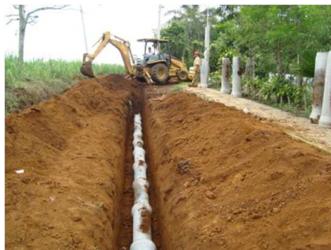
INSTALACIÓN DE TUBERÍA DE CONCRETO DE 8"Ø