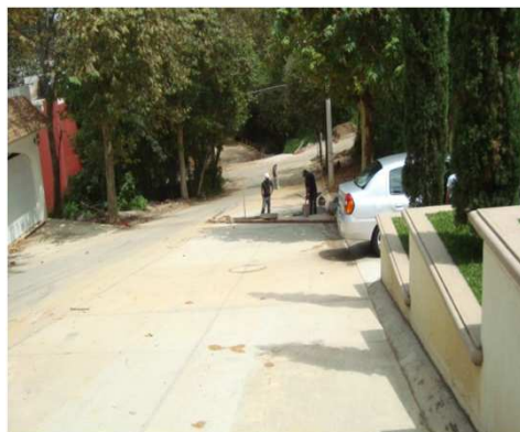
CAEV COMISIÓN DEL AGUA DEL ESTADO DE VERACRUZ OBRA TERMINADA